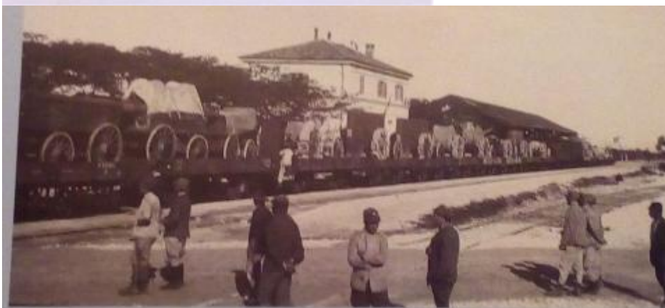
1916. San Giovanni di Manzano, Civili e soldati, davanti alla Stazione ferroviaria, osservano il passaggio di un treno carico di Batterie 280 in partenza per il Trentino. (f. 266)